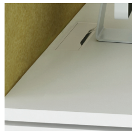
Schreibtisch mit Aussparung für Kabeldurchlass und Kabelführung