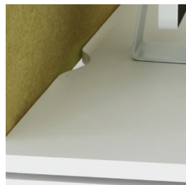
Schreibtisch mit Randeinkerbung für Kabelführung